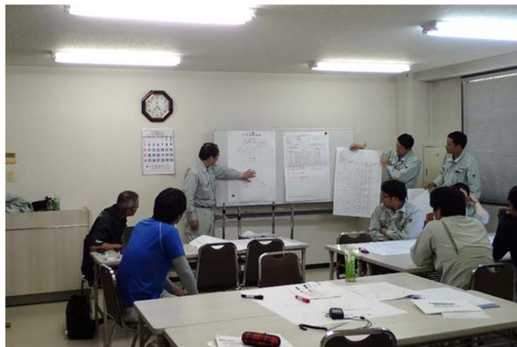
【点検結果の発表の様子】

実習の最後に、各班にて取りまとめた点検結果および橋梁の健全度の発表を行いました。